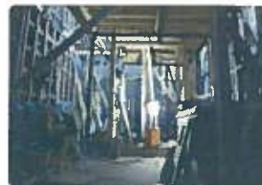
夜間の工事現場の照明