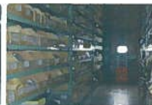
工場・倉庫の照明