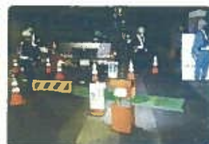
安全封鎖、歩行者用足元照明