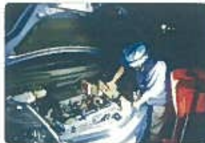
明かりの無い場所、車の点検