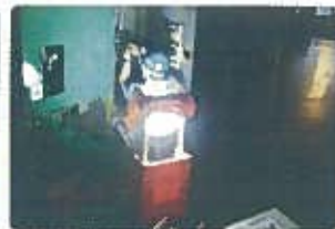
停電時機械の点検