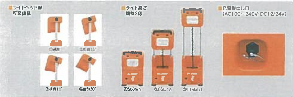
本カタログ製品は予告なく変更する場合があります。

三笠産業株式会社 MIKASA SANGYO CO., LTD. TOKYO, JAPAN