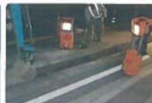
屋外の夜間工事現場の照明