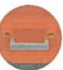
盗難防止用フック