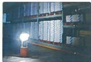
停電時食糧の照明