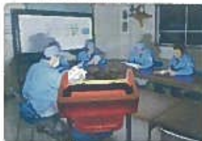
緊急時事務所の照明