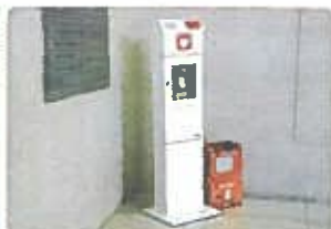
公共施設の緊急用照明