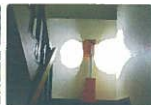
夜間の施設内照明