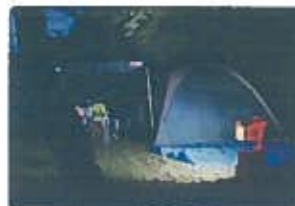
キャンプ等のレジャー用照明